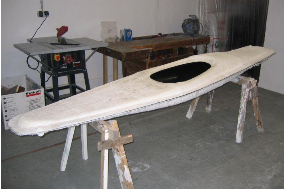
Forma kajaku- Acrystal Prima s epoxidovým gelcoatem Kajak Components - Hendrik Bretzke - Berlín