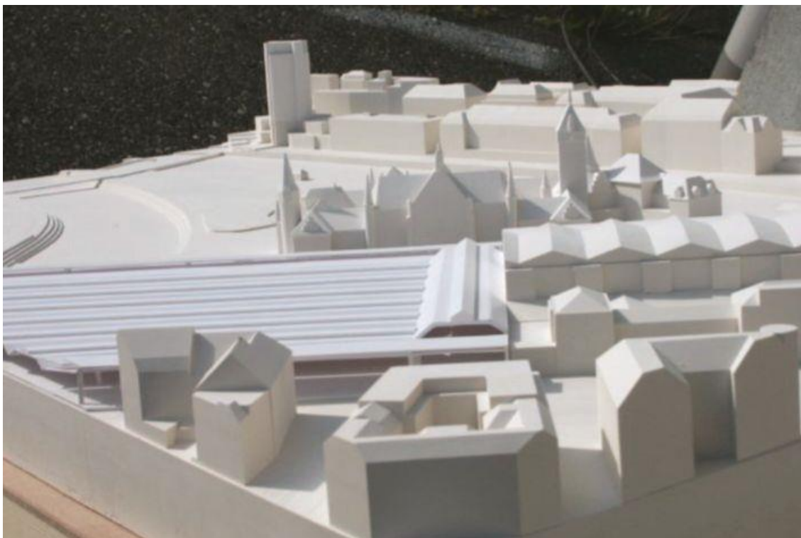
Architektonický přesný model - Architektonický konkurz na "Schweizerisches Landesmuseum" v Curychu Model od K. Siegrist Modelbau - Staufen - Švýcarsko